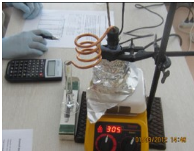
Joonis 2. Destilleerimine