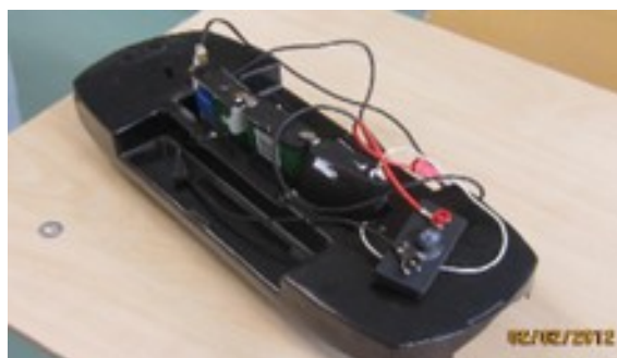
Joonis 3. Elektriauto mudel